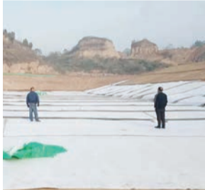
文·图/第五分公司 郎洪涛

随着A段库尾A0+600-A1+100库底及边坡防水毯下基础回填工序施工及验收完毕,引水入密工程云蒙山水库工程于11月1日正式进入防水毯铺设施工阶段。引水入密工程施工项目部从防水毯生产、进场、铺设、验收方面严把质量关,保证施工质量,目前已铺设防水毯55000㎡。